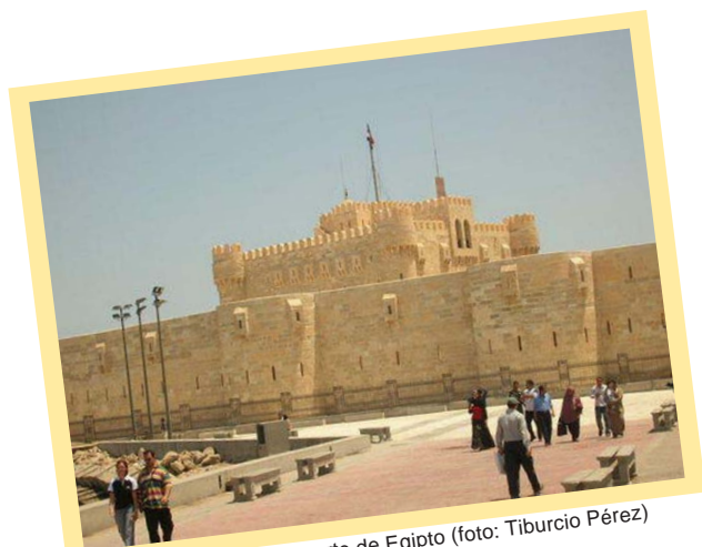
Ciudad de Alejandría al norte de Egipto