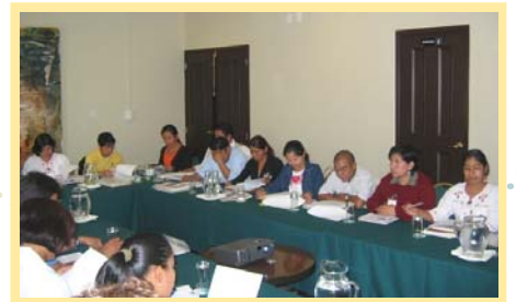
Becarios electos IFP Generación VI