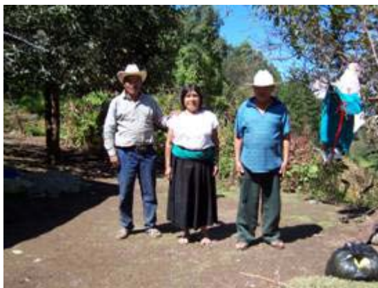
Personas disfrutando de un atardecer de la comunidad de Ocotempan, Athahuilco, Veracruz

Es también maravilloso ver en vivo y a todo color el ciclo hidrológico. Este ciclo sólo se puede disfrutar estando en el interior de los bosques; es algo tan bonito ver cómo los pinos y los encinos transforman la nube en agua y cuando miras hacia el cielo, el agua te cae en la cara y logras beber algunas gotas de ese vapor transformado en líquido. Si continúas caminado logras ver cómo las nubes van entrando al interior de los bosques, y nuevamente logras oler el aroma a tierra y a hojarasca mojada, si aspiras ese aire limpio y lo expeles al mismo tiempo, sientes que tu alma y tu vida se purifican.