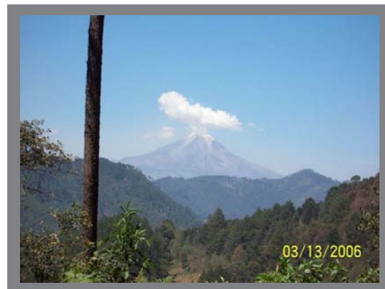
Bosque de Pino encino con el Citlaltepetl al fondo, vista desde la comunidad de Tlaquetzaltitla, Tlaquilpa, Veracruz, México