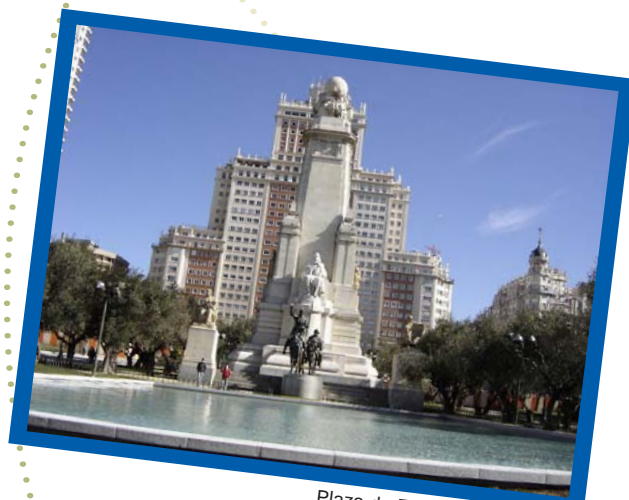
Plaza de España (foto: Rodolfo)