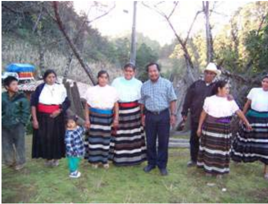
Mujeres vistiendo su traje tradicional de la comunidad de Tlaquetzaltitla, Tlaquilpa, Veracruz

Otro acontecimiento maravilloso es observar las diferentes estaciones del año; en julio-septiembre las precipitaciones, llueve todo el día y a veces toda la noche, se ven derrumbes, nacimientos y escurrimientos de agua, el verdor de las plantas. En octubre-diciembre se ven las gigantescas nubes que cubren la montaña, los árboles y las casas de láminas ubicadas en las laderas. En enero-marzo con el frío y las heladas sientes que sólo los calmas con una taza de café y tortillas recién calentadas en las brazas. En abril-junio los amaneceres más impresionantes son de un verdor espectacular, cuando te encuentras al interior de los bosques sientes que la hojarasca, el pasto y los arbustos te invitan a permanecer más tiempo en él.