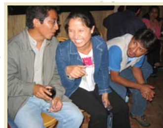
Becarios electos IFP Generación VI