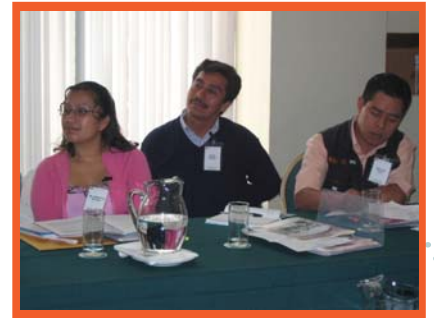
Becarios electos IFP Generación VI