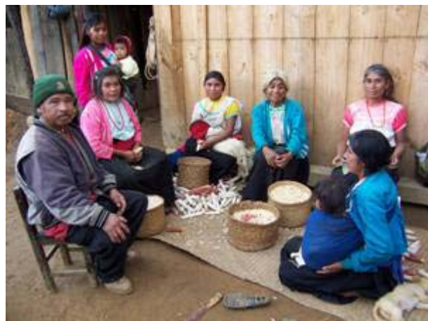
Reunión familiar en la comunidad de Tepexititla, Atlahuilco, Veracruz

También el vestir de la gente varía de región a región, en las fotos podrán ver el vestido tradicional de las personas de las montañas.