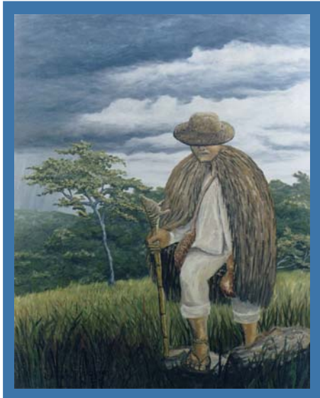
Pintura de Justiniano Domínguez Técnica: óleo sobre tela