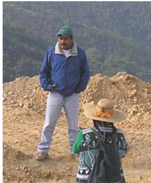
Filemón en la Sierra Norte de Oaxaca

La zona es reconocida internacionalmente por su importancia biogeográfica, su riqueza étnica y la riqueza biológica de la zona tiene que ver con la orografía de la región, la cual se caracteriza por las fuertes pendientes y una gran variabilidad de condiciones en muy poco espacio físico. Sin embargo este factor por sí mismo no es suficiente para explicar totalmente la gran biodiversidad existente, ya que ésta se halla asociada a la diversidad de culturas que habitan en ella y que han sido capaces de adaptarse a las difíciles condiciones del terreno volviéndolo productivo y diverso.