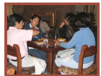
Becarios electos IFP Generación VI