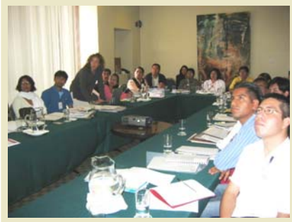
Marina dando su presentación a los becarios