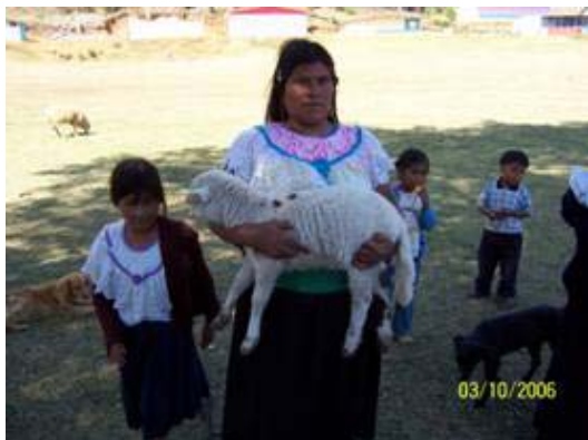
Mujer de la comunidad de Tepexititla, Athahuilco, Veracruz

El estado de Veracruz con 72815 km 2 y 6 millones 228 239 habitantes se encuentra integrado por siete regiones, cada una cuenta con diferentes condiciones climáticas, topográficas y flora, además de su riqueza en playas, bosques y su agroindustria.