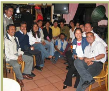
Becarios electos IFP Generación VI y Becarios IFP