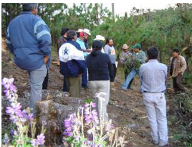
Taller sobre la conservación del agua y el suelo en una comunidad zapoteca

que muchas comunidades de Oaxaca están viviendo un proceso de transformación por efectos de la migración constante y los procesos de globalización que están incidiendo y transformando el estilo de vida de las comunidades, pasando de un estilo de vida campesina donde se vive y convive con la naturaleza y los recursos