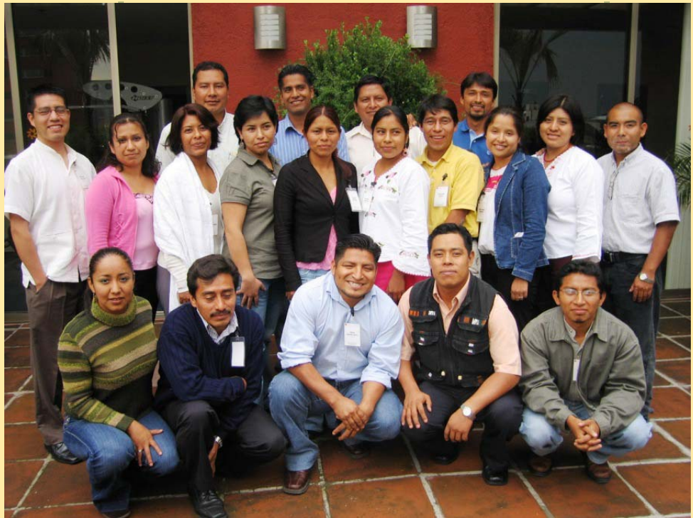
IFP Generación VI - México